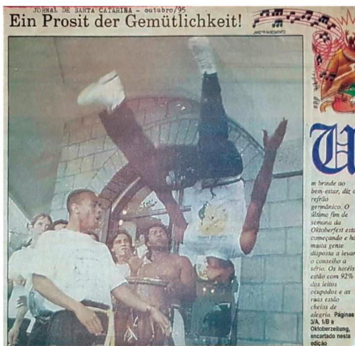
Figura 1 - Imagem de capa do Jornal de Santa Catarina – outubro de 1995